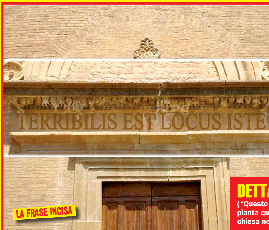
LA FRASE INCISA

Uno scritto a Bibbona svelerebbe la sua tomba e l'amore per la Maddalena