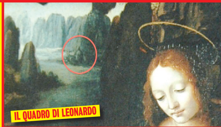
IL QUADRO DI LEONARDO

DETTAGLI Bibbona (Livorno). A sinistra, l'incisione sul portale "Terribilis est locus iste" ("Questo luogo incute rispetto"). Sopra, la rara scelta della pianta quadrata per l'architettura della cattedrale. Sotto, la chiesa nel particolare del quadro La Vergine delle Rocce .